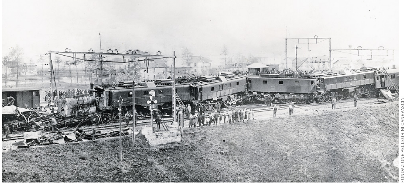
Was nach dem Unglück vom 23. April 1924 in Bellinzona von den beiden Schnellzügen übrigblieb. 15 Menschen starben.

Veronica Galster veronica.galster@sev-online.ch