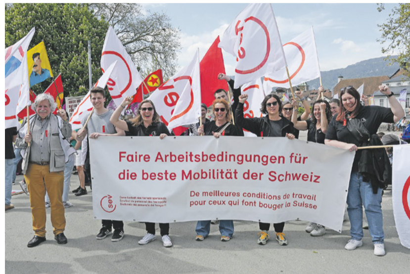
Starke SEV-Präsenz in Solothurn.