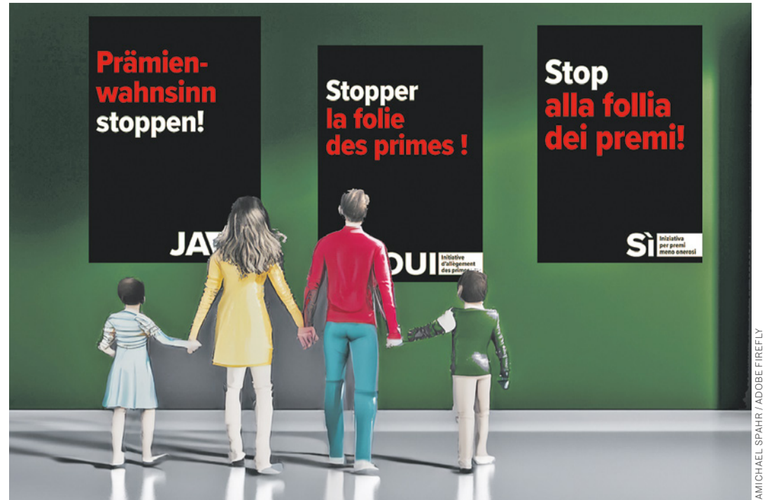
Der SEV-Vorstand beschliesst die Ja-Parole zur Prämien-Entlastungs-Initiative.

Der Vorstand fasst die Parolen für die Abstimmungen am 9. Juni. Er unterstützt die Prämien-Entlastungs-Initiative, die fordert, dass die Krankenkassenprämien nicht mehr als 10% eines Haushaltseinkommen betragen dürfen. Ein Ja würde dazu führen, dass die Krankenkasse sozialer wird und Menschen mit kleinen und mittleren Einkommen tatsächlich entlastet