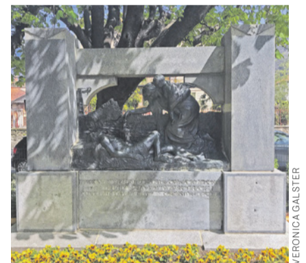
Das von SEV-Eisenbahnern initiierte Denkmal für die Verunglückten.

Obwohl sich die Sicherheitsvorschriften weiterentwickeln, sind tödliche Unfälle am Arbeitsplatz auch heute noch eine traurige Realität, auch bei der Bahn, wie uns die tragischen Unfälle der letzten Jahre leider in Erinnerung rufen. Für den SEV ist und bleibt die Bahnsicherheit ein vorrangiges Thema. Er vertritt stets die Haltung, dass zu deren Gewährleistung nicht nur die Mitarbeitenden alle möglichen Massnahmen ergreifen müssen, sondern auch die Unternehmen und die zuständigen Aufsichtsorgane.