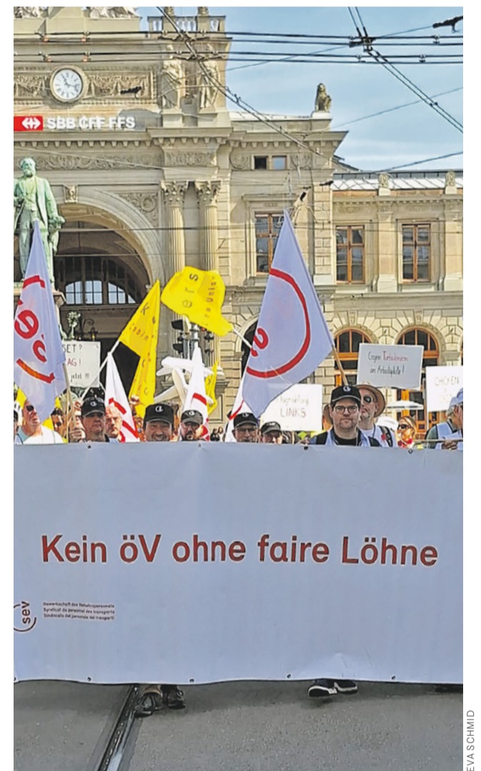
Der grösste Umzug der Schweiz findet in Zürich statt.