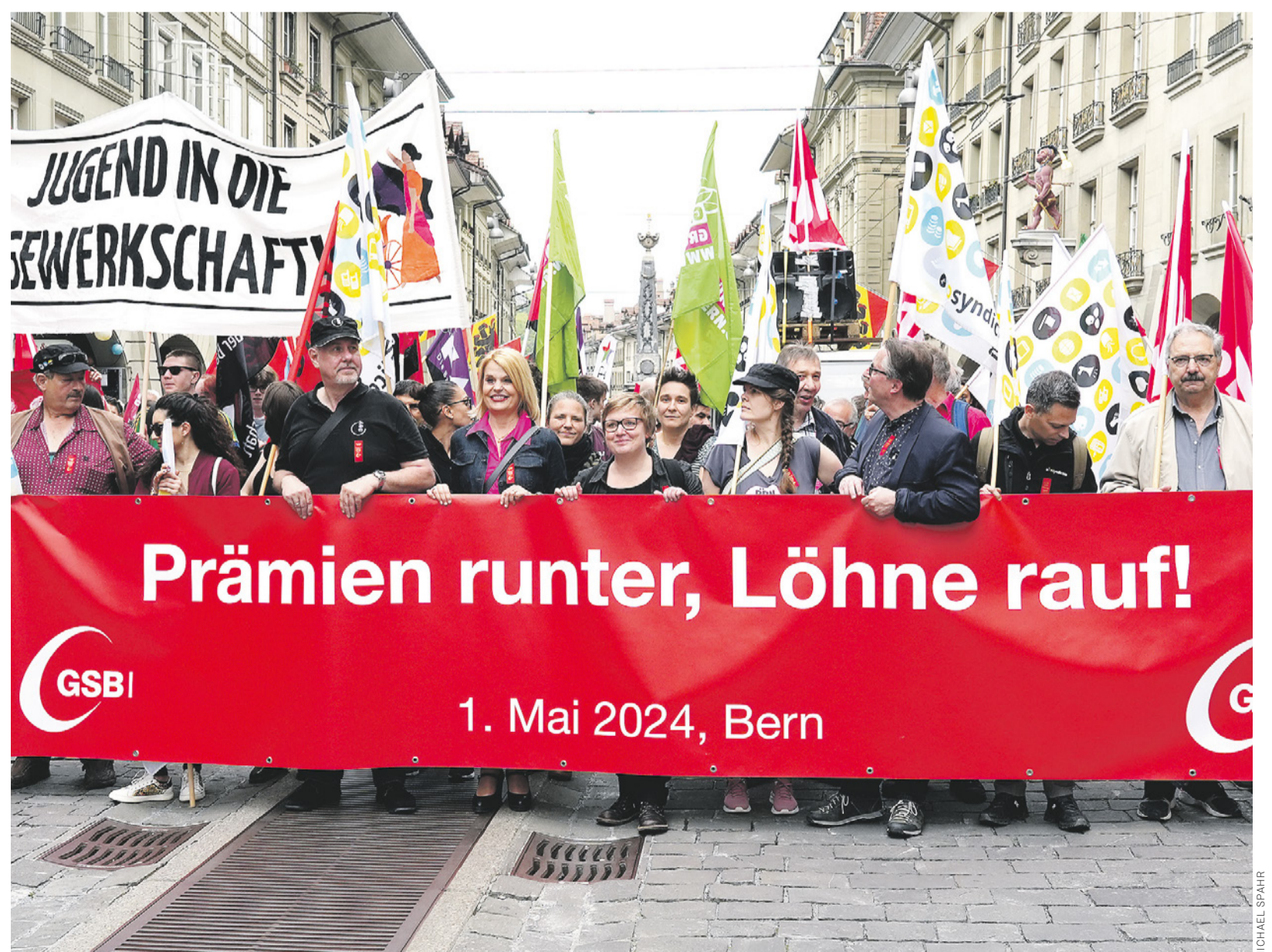
In Bern geht ein breites Bündnis von Gewerkschaften und Parteien für höhere Löhne auf die Strasse.