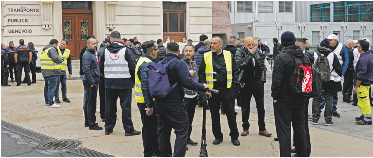
Mit der Vereinbarung anerkennen die TPG die hohe Belastung des Personals und wollen sie reduzieren und kompensieren.