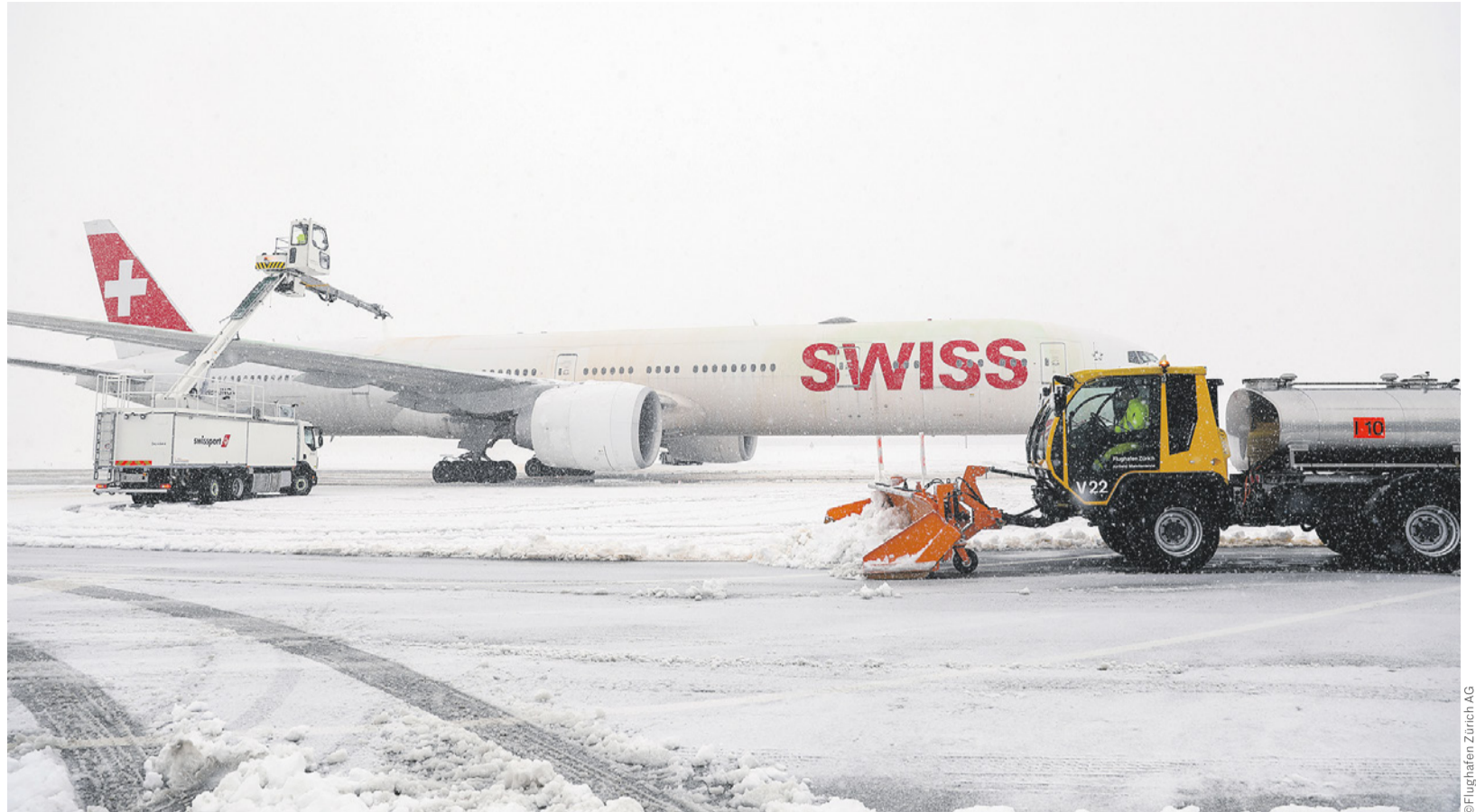
Mit den Sparmassnahmen leistet das Bodenpersonal der Swiss einen schmerzhaften aber wichtigen Beitrag zum Überleben des Unternehmens.

Der Schweiz. Gewerkschaftsbund ist gegen die Vollprivatisierung der Postfinance, wie sie der Bundesrat am 20. Januar präsentiert hat: «Die Postfinance ist eine Volksbank mit fast drei Millionen Kund/innen und gehört als Teil des Post-Konzerns der Allgemeinheit. Sie erfüllt im Zahlungsverkehr seit Jahren erfolgreich einen gesetzlichen Grundversorgungsauftrag. Dieser würde unterminiert und müsste mit einer Konzessionsvergabe sichergestellt werden. Zudem würde die Post aufgespalten. Sie funktioniert aber nur über ihr in sich geschlossenes Geschäftsmodell mit vielen innerbetrieblichen und finanziellen Verflechtungen wie den Synergieeffekten des Postnetzes.»