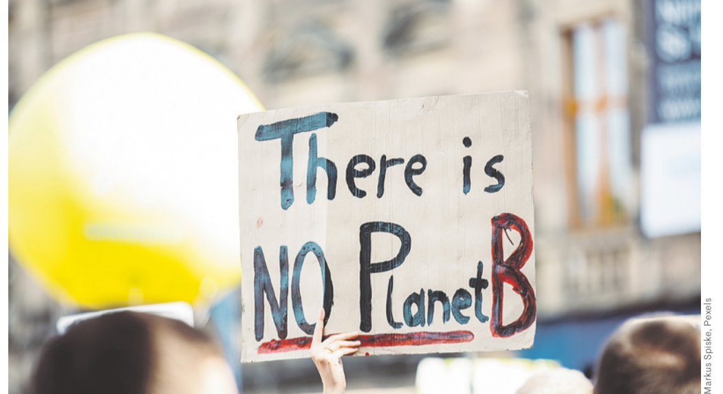
Die Klimabewegung ruft mit ihrem Aktionsplan zum Handeln gegen die Klimakrise auf.

Die SBB gab am 21. Januar bekannt, dass sie in den Officine von Bellinzona ab Mitte 2022 – vier Jahre früher als ursprünglich geplant – auf die Revision der Güterwagen verzichten wird. Im Gegenzug soll in den Officine 2.0 die gesamte Astoro-Flotte gewartet werden. Die erweiterte Personalkommission und die «Bewegung für den Sozialismus» sind nicht glücklich über den Entscheid und fordern den Staatsrat dazu auf, einzugreifen und die Arbeitsplätze zu retten.